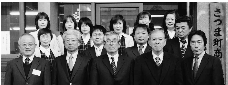
新年を迎え会員のためにヤル気いっぱい正副会長と職員

これらの宝の原石 を発掘して磨けば必 ず勝機はやって来ま す。ヤル気と情熱と 継続です。暖かいフ ォローの風にアンテ ナを磨き、帆を張っ て大きく受け止めま しょう。今こそ「商 人根性」の発揮のし どころです。頑張り ましょう!